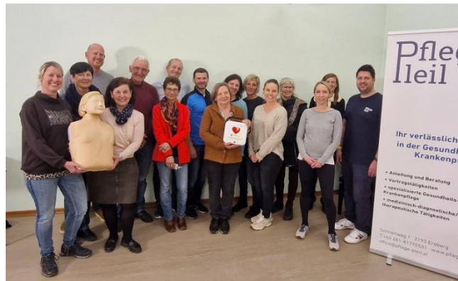
Erste Hilfe Kurs 14.03.2025